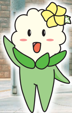
平野区 マスケットキャラクター 「ひらちゃん」

主催:第16回産業交流フェア実行委員会 共催:一般社団法人 平野産業会、一般社団法人 加美工業会、一般社団法人 東住吉産業会、 大阪府中小企業家同友会 平野支部、大阪府中小企業家同友会 東住吉支部、 公益社団法人 大阪市工業会連合会、地域産業活性化委員会、東住吉区役所、平野区役所 後援(予定):大阪商工会議所 南支部 協力:大阪市立クラフトパーク