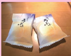
(有)御菓子司かつらや